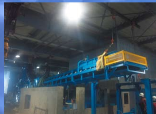
コンベヤ 据付工事