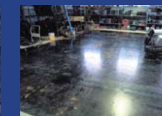
工場内製作作業対応(床敷き鉄板)