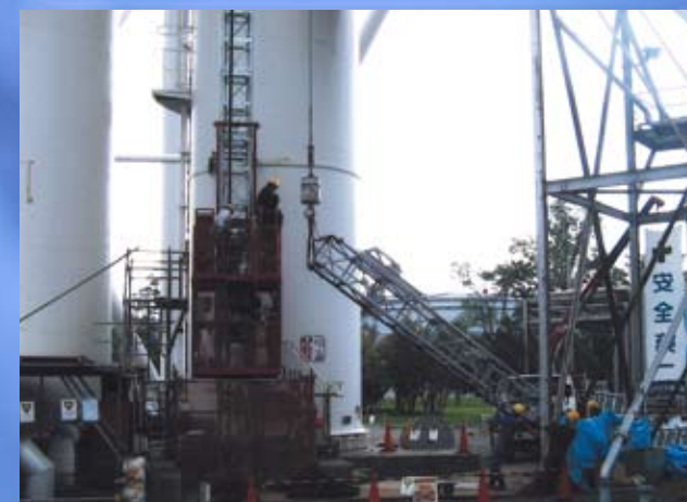
火力発電所200m煙突 点検用エレベーター交換工事