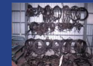
吊りワイヤー各種