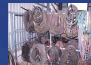
溶接キャップタイヤ・ガスホース関係