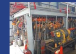
チェーンブロック