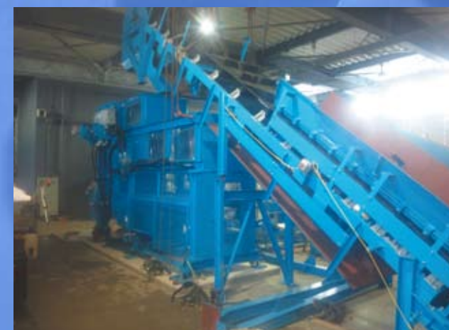
リサイクルコンベヤ増設工事